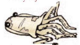
calamar m sépie, kalamár