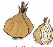
cebolla f cibule